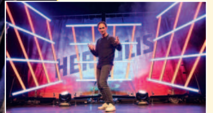
Mit Bombast-Show auf Tour. Alle Termine: Ticket24.at.