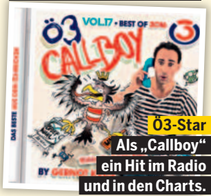
Ö3-Star Als „Callboy“ ein Hit im Radio und in den Charts.

die Absurdität von Donald Trump und Co. hat man nach oben hin mehr Spielraum!“